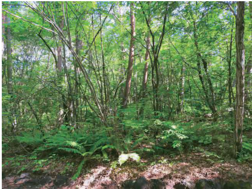
※写真は販売区画周辺を2024年8月に撮影したもので、周辺の環境は将来的に保証されるものではありません。