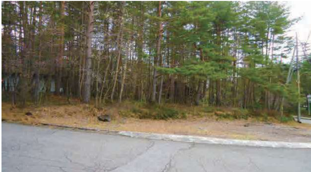
※写真は販売区画周辺を2022年8月に撮影したもので、周辺の環境は将来的に保証されるものではありません。