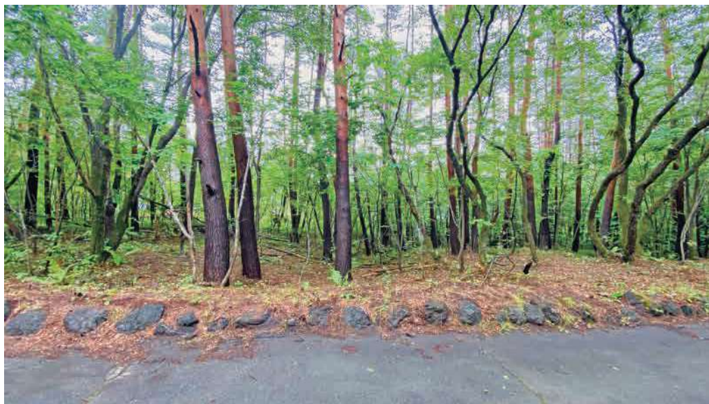
※写真は販売区画周辺を2024年7月に撮影したもので、周辺の環境は将来的に保証されるものではありません。