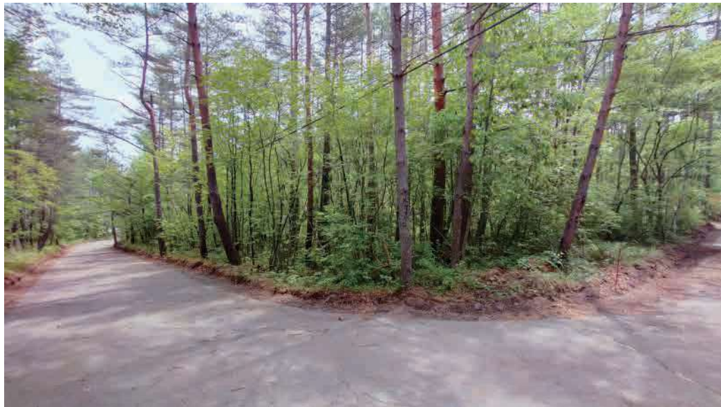
※写真は販売区画周辺を2024年8月に撮影したもので、周辺の環境は将来的に保証されるものではありません。