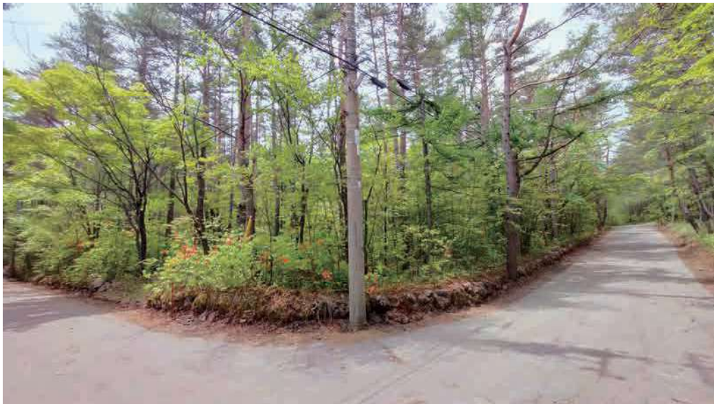
※写真は販売区画周辺を2024年8月に撮影したもので、周辺の環境は将来的に保証されるものではありません。