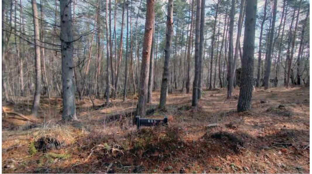
※写真は販売区画周辺を2023年4月に撮影したもので、周辺の環境は将来的に保証されるものではありません。